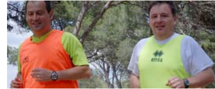
Magnum & Bizounours

Ceci dit, pendant l'été 2008, il y a toujours eu du monde le mardi et souvent le vendredi. Si vous êtes là, venez et amenez vos invités.